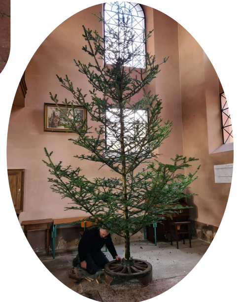
Mise en place du sapin à l'église