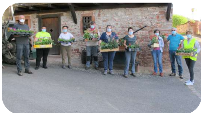
Plantation des fleurs le 27 mai