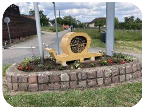
Hôtel à insectes en forme d'escargot réalisé par Pierre