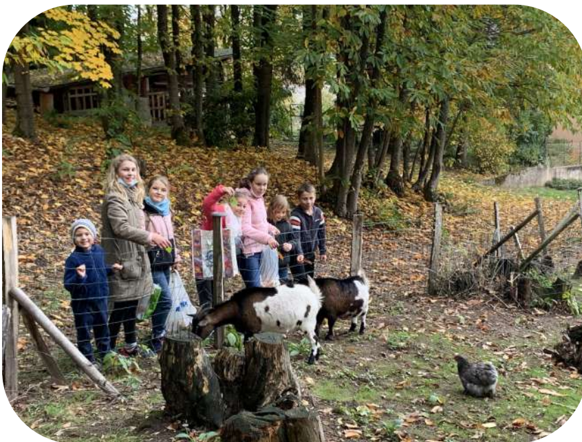
Petits rigolos : sortie en forêt