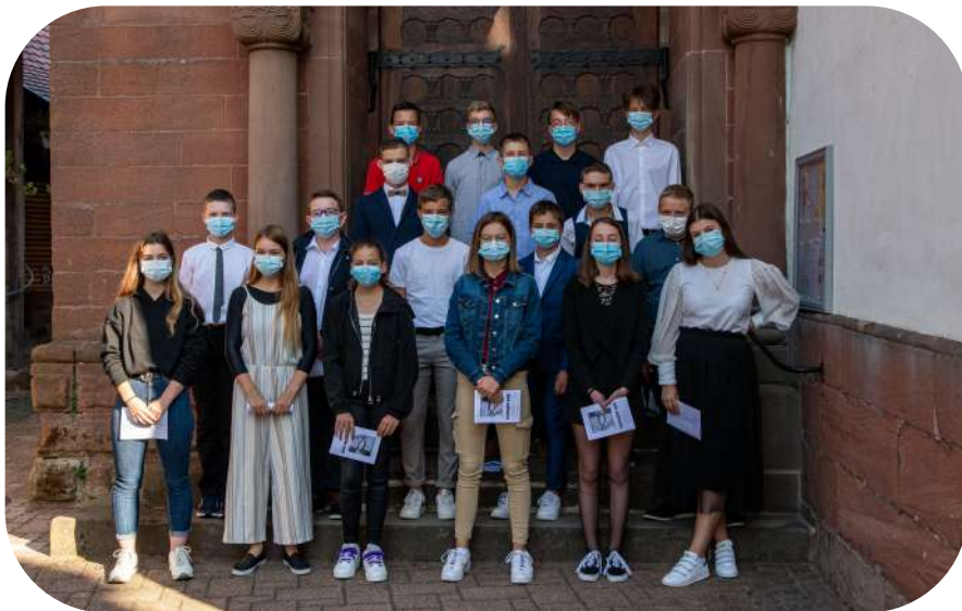
18 octobre : Confirmation