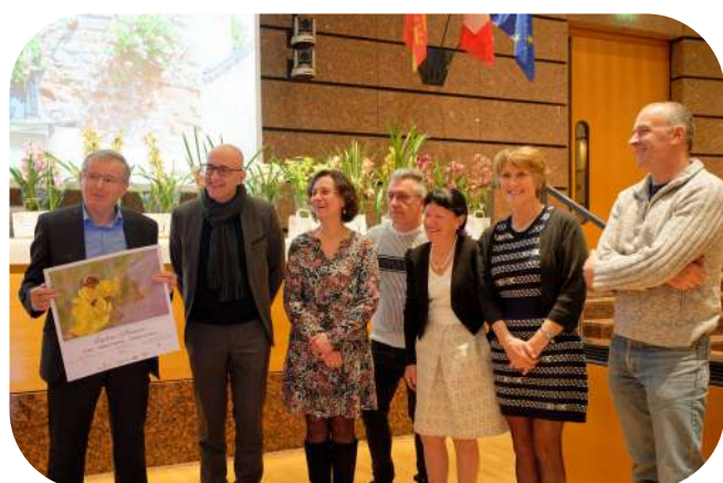
Remise prix de la créativité